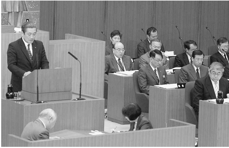
経済委員会委員長報告の様相（本会議場にて）

我が国の経済は、東日本大震災からの復興需要や、ヨーロッパの金融危機からの脱却を前提として、緩やかに回復していくことが見込まれる一方で、札幌市の現状は、雇用情勢の停滞や企業の景況感の悪化など、依然として厳しい状況にあると認識している。こうした中、国は、